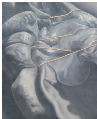
Marie-Claude Lacroix, Pensées intrusives (part 4) , 2021.