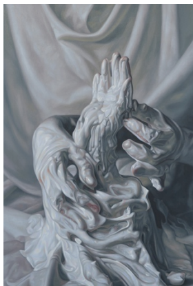
Rosalie Gamache, Mains blanches I , 2021.

représentation d'objets informes, qui échappent à l'identification. Si cette exposition est sous-tendue par des réflexions de nature philosophiques et psychologiques sur notre rapport aux images et aux illusions, son pari est d'éveiller un intérêt pour ces questions par la simple séduction plastique des œuvres, et de le nourrir par l'expérience perceptive et affective de ces espaces picturaux inventifs.